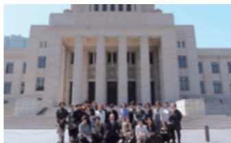
3月31日 群馬県ママさんバレーOG会

国会議事堂の見学や参議院議員会館の羽生田事務所へ是非おいでください。 本会議や委員会も傍聴できますので、事務所宛てお問合せください。