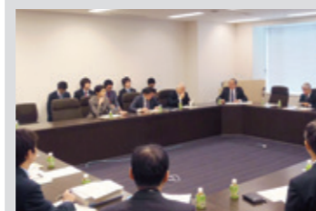
3月20日 成育基本法成立に向けた議員連盟 準備会