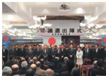
3月1日 群馬県議選「出陣式」