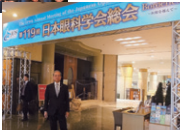
4月19日 日本眼科学会総会