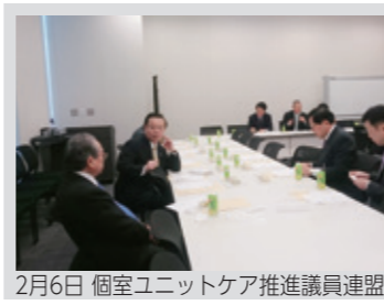
2月6日 個室ユニットケア推進議員連盟