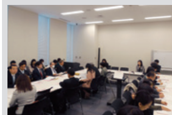
3月4日 乳がん・子宮頸がん検診推進議員連盟