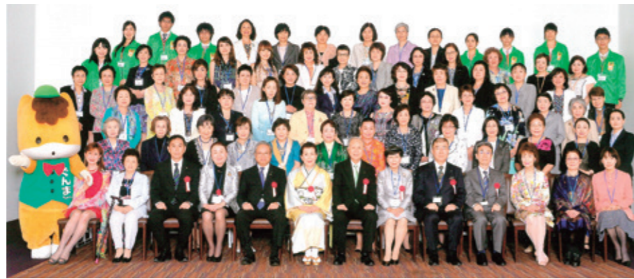
5月16日 日本女医会第60回定時総会・懇親会