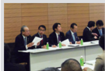
3月5日 眼科医療政策推進議員連盟