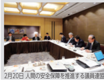
2月20日 人間の安全保障を推進する議員連盟