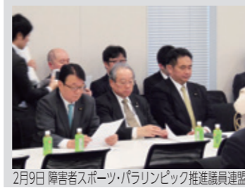
2月9日 障害者スポーツ・パラリンピック推進議員連盟