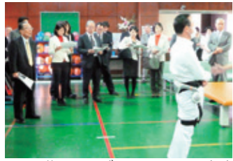
群馬リハビリテーション病院

群馬リハビリテーション病院や県内の介護施設など介護・医療制度および労働問題に関する実地調査を行いました。