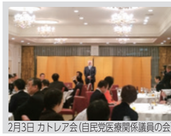
2月3日 カトリア会(自民党医療関係議員の会)

5月13日の設立総会は、100名近い多数の自民党国会議員(秘書代理含む)のご出席で大盛会のスタートとなりました。日本医師会の周産期・乳幼児保健検討委員会の答申をたたき台として法案を文案化し、国会提出を目指して参ります。