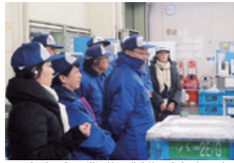
富士重工業群馬製作所大泉工場