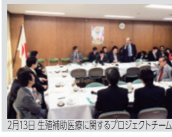
2月13日 生殖補助医療に関するプロジェクトチーム