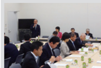
5月13日 成育基本法成立に向けた議員連盟 設立総会