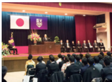
3月7日 東京医科大学医学部卒業式