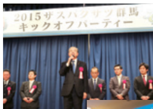
2月15日 ガスパ草津群馬 新体制発表会・ キックオフパーティー