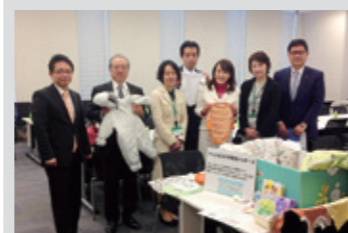
4月8日 人口減少対策議員連盟