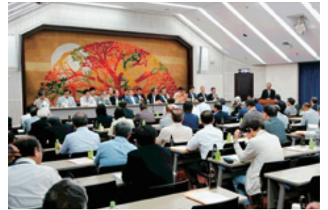
9月15日 愛知県医師会 会長会議