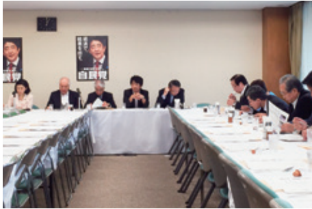
9月16日 国際保健医療戦略特命委員会