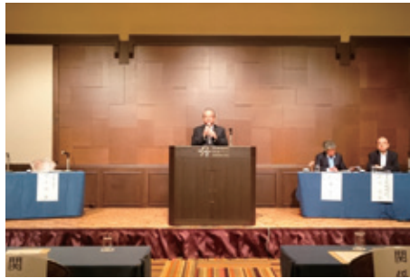
8月29日 北九州市医師会主催「病院長会議」