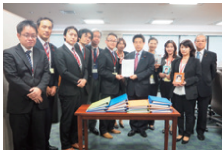
10月27日 小児脳幹部グリオーマの会の皆様と 塩崎厚生労働大臣へ要望書提出