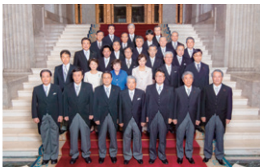
9月26日 第192回 国会開会式

委員会の冒頭に委員長としての就任挨拶をする機会を得ました。厚生労働委員会は国民の生活に直結する議案が多いため、幅広く議論を重ねる必要があること。その為には委員長として、公正かつ円満な委員会運営に努めて参る事を述べました。