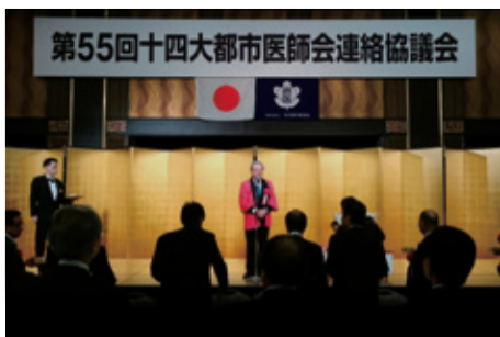
10月22日 第55回 十四大都市医師会連絡協議会 (名古屋開催)