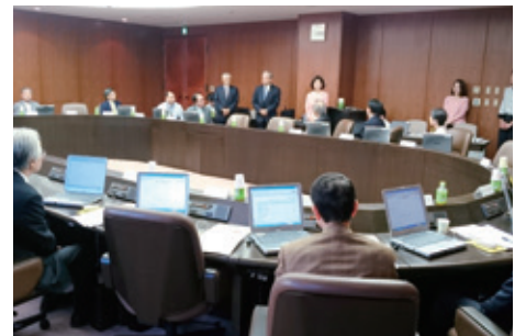
10月12日 新潟県医師会 理事会