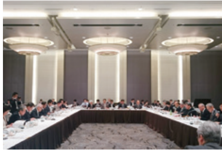
10月18日 医療政策研究会 (会長: 武見敬三参院議員)