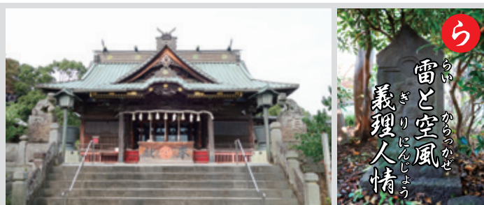
上毛カルタより 邑楽郡「雷電神社」高崎市「蓮花院の雷神石像」昔から群馬県人は「義理人情にあつい」といわれてきました。

今までは与党の筆頭理事として与党国対との連携、また野党の筆頭理事との交渉や調整など、委員会の下働きや仕込みという役割を負ってきましたが、委員長という立場は与野党関係なく公正に委員会を運営し丁寧に法案の審議をし採決を行う事が最大の責務であります。しっかりと頂いた職務への使命と責任を果たして参ります。