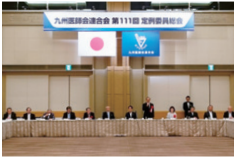
8月27日 九州医師会連合会 総会