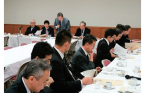
10月27日 有床診療所の活性化を目指す議員連盟 総会