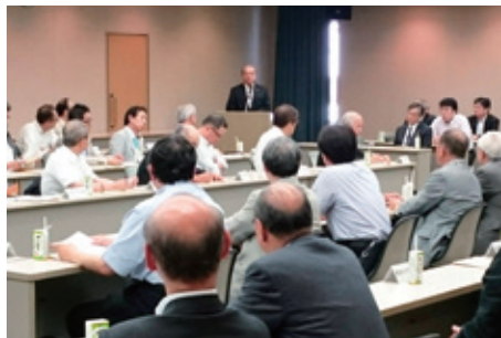
9月23日 大阪府都市区等医師会長協議会