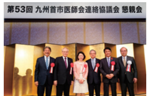
10月29日 九州首市医師会 (福岡市医師会主催)