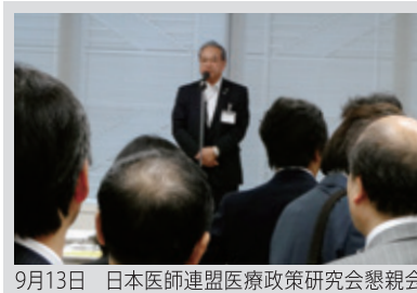
9月13日 日本医師連盟医療政策研究会懇親会