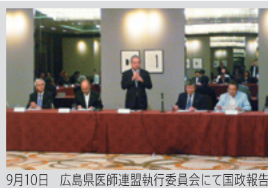
9月10日 広島県医師連盟執行委員会にて国政報告