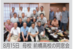
8月15日 母校 前橋高校の同窓会