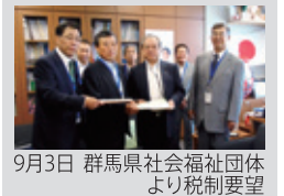
9月3日 群馬県社会福祉団体より税制要望