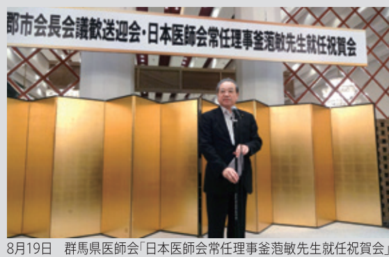
8月19日 群馬県医師会「日本医師会常任理事釜谷敏先生就任祝賀会」