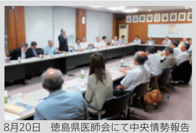
8月20日 徳島県医師会にて中央情勢報告