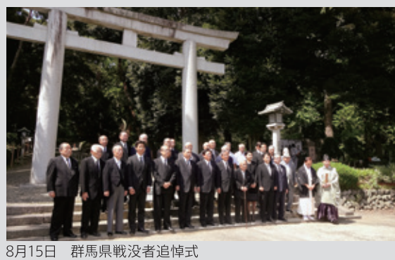
8月15日 群馬県戦没者追悼式