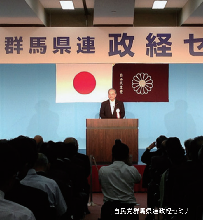
自民党群馬県連政経セミナー