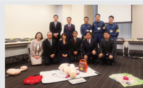
11月24日 AED勉強会 AEDを使用すれば救えた命があることをご理解いただき、これから東京オリンピックなどで多くの観光客が日本に来られることから、丸川大臣にもAEDを体験していただきました。設置だけでなく維持管理や設置場所の掲示なども含め啓発をしています。