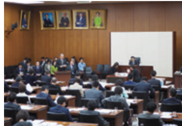
12月7日 衆議院厚生労働委員会(がん対策基本法改正案の趣旨説明)