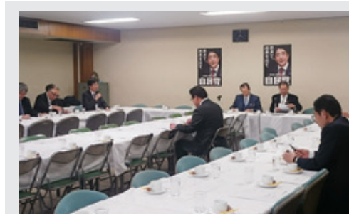
12月8日 医師偏在是正に関する研究会 診療科目の偏在、地域偏在、研修制度、専門医に関するものなど複合的な要因から医師の偏在是正に関して省庁横断的に意見交換を活発にしています。