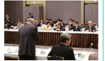
11月24日 医療政策研究会 朝食勉強会