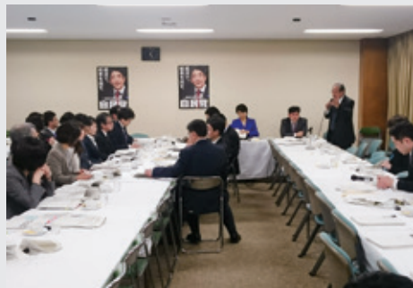
11月24日 平成29年度の医療・介護関連予算について検討し、特に介護の自己負担3割の問題や「かかりつけ医」以外を受診した場合の定額負担について議論が行われました。