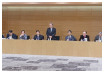
12月15日 愛媛県医師会理事会