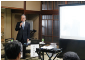
11月23日 岐阜県医師連盟講演会・懇親会