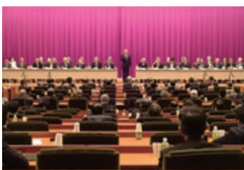
1月17日 日本医師連盟執行委員会