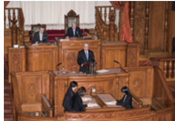
12月14日 参議院本会議(年金制度改革法案の厚生労働委員長報告)