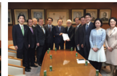
11月30日 医療政策研究会 自民党幹事長へ申し入れ