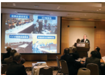
12月11日 東京医大医学部医学科同窓会 各部・委員会全体会議