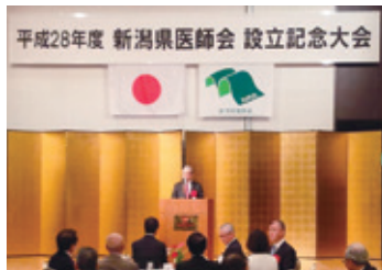
11月12日 新潟県医師会創立記念大会