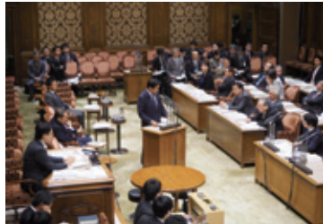
11月10日 参議院厚生労働委員会と法務委員会の連合審査会