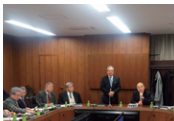
12月22日 三重県医師会理事会