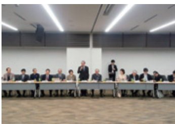
12月16日 東京都医師会地区医師会長連絡協議会