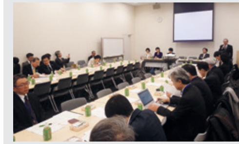
11月24日 バイオ医薬品勉強会 バイオ医薬品に関して先行品の支援がままならないまま、安易なシミラー(後続品)の推進の検討が経済・財政論だけで進む事を危惧し、バイオ医薬品のしっかりとした理解と将来像を議論していきます。