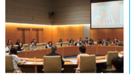
11月18日 国際母子栄養改善議員連盟総会