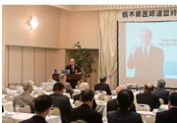
12月17日 栃木県医師連盟講演会・懇親会