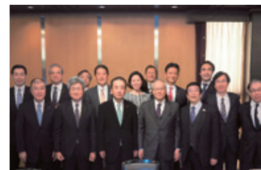
11月29日 カトリア会総会(医療関係職種の議員連盟)