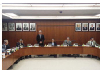
12月22日 愛知県医師会理事会