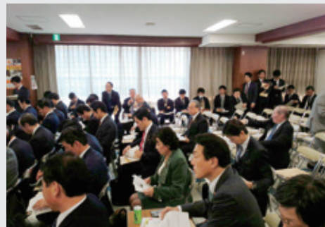
11月30日 医療機関の設備投資に対する課税の特例措置の創設を強く要望しました。当初、検討されない予定でしたが、私の発言を受けて検討されることになりました。