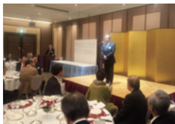
12月10日 西宮市医師会会員親睦年忘れの会