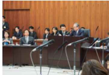
12月13日 参議院厚生労働委員会(年金制度改革法案が可決)