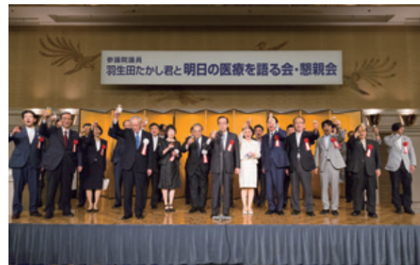
平成27年9月15日 懇親会の様子(福田元総理のご発声で乾杯)