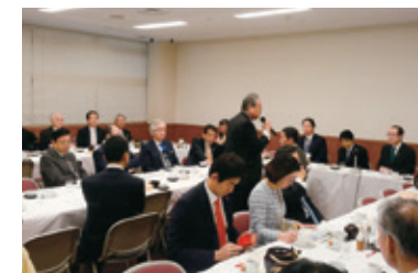
11月30日 自由民主党臨床検査に関する制度推進議員連盟