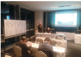
11月12日 東京医大同窓会新潟県支部総会