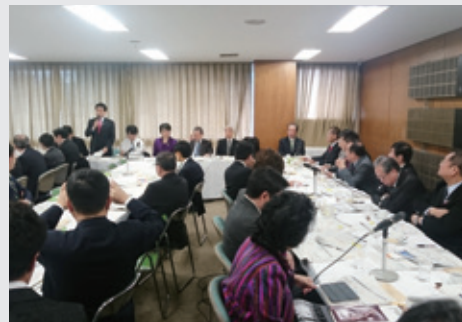
12月15日 平成29年度厚生労働関係予算案について審議を行い、高額療養費制度の見直しについては高齢者の負担増が当初案より少なくなる形で決着いたしました。