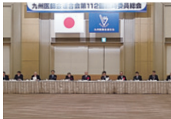
11月18日 九州医師会連合会総会・九州各県医師会役員合同懇親会