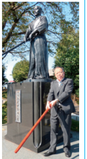
狩野浩志 群馬県議会議員