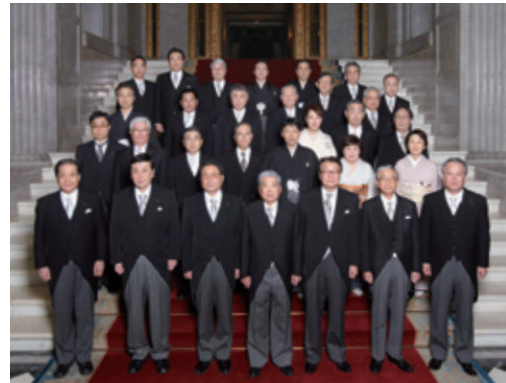
1月20日 通常国会召集日

医療法や介護保険法の改正など医療・介護に関わる法律も多く、党の厚生労働部会ではしっかりと発言をし、厚生労働委員会では真摯にかつ丁寧に、ひとつひとつ議論を積み重ねて参りたいと思っております。