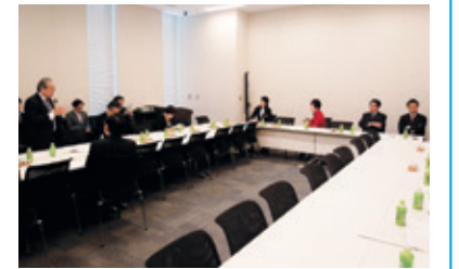
11月28日 自民党受動喫煙防止議員連盟緊急総会