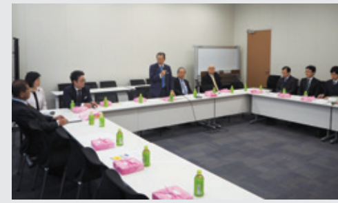
11月18日 成育基本法成立に向けた議員連盟役員会を開催し、先般の参議院選挙において初当選を果たされた自民党唯一の小児科医である自見はなご議員をあらたに事務局次長として役員に就任いただきました。成育基本法の制定にむけ議論を加速して参りたいと思います。